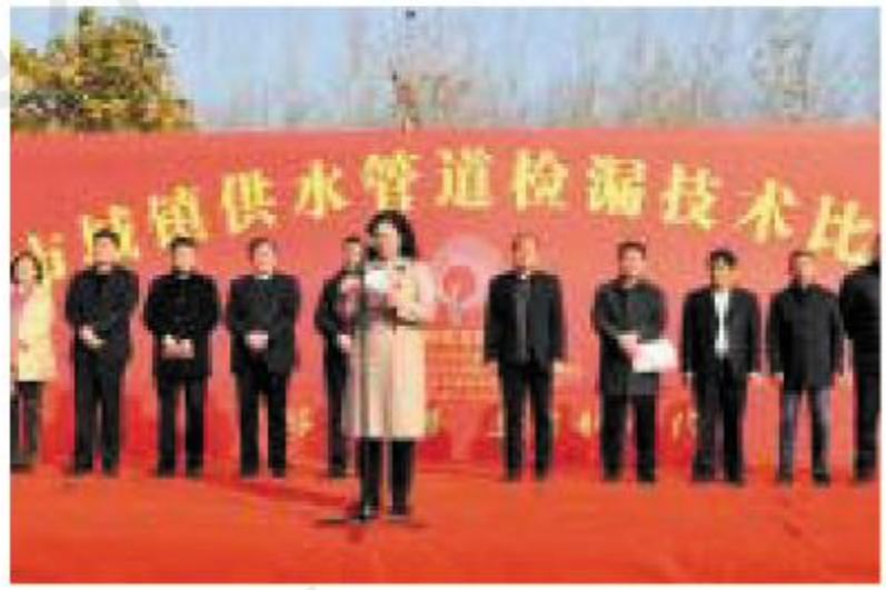
淄博市引黄供水有限公司、淄博高新区涌泉供水有限公司、寿光市自来水有限公司安排有关人员观摩了比赛。

11月20日,由淄博市水利与渔业局主办的淄博市首届城镇供水管道检漏技术比武在桓台县落下帷幕。比赛由淄博市供水系统思想政治工作研究会、桓台县万泉供水有限公司承办,市自来水公司及各区县供水企业组成8支代表队参赛。淄博市水利与渔业局副局长蒋卫霞出席开幕式并讲话。 开幕式结束后,与会领导围绕供水管网漏损控制、水价、二次供水管理、智慧水务建设等行业热点问题进行了座谈交流。参赛人员及相关业务人员围绕供水管网漏损控制技术及检漏器材应用等进行了培训和交流。此次比武专业化水平较高,重点考察参赛选手对漏点的分析判断和精确查找能力。在下午的正式比赛中,16名参赛选手用检漏仪、听音杆进行漏点检测,比赛设置了混泥土、人行道花砖、沙土路3种不同模拟路面,路面下提前埋设了多类型管材,设置了不同位置的漏点。经过紧张的比赛,选拔出了一批作风过硬、技术精湛的检漏技术能手,并分别授予“金耳朵”、“银耳朵”、“铜耳朵”称号,同时对比赛成绩优异的代表队进行了表彰。通过技术比武加强了管道检漏技术经验交流,对于提升漏损控制工作的开展奠定了基础。 淄博市引黄供水有限公司、淄博高新区涌泉供水有限公司、寿光市自来水有限公司安排有关人员观摩了比赛。