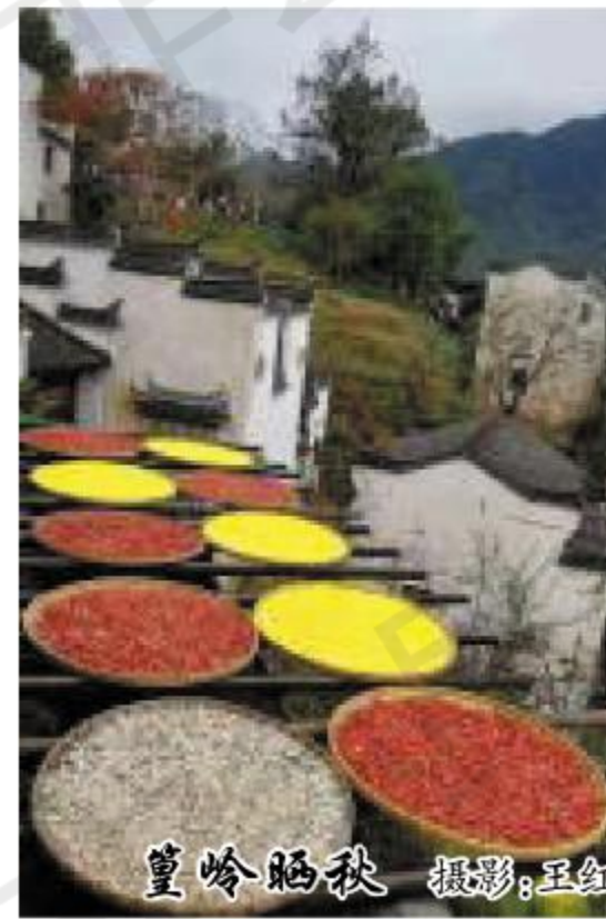
皇岭晒秋

刚刚立春,阳台上便开始露生机,粉、黄、白三个不同品种的玛格丽特就开始次第开放,热热闹闹的,会一直开到五一。这时候其他的花儿也不甘示弱,压弯了枝头的天竺葵,爆盆了的垂吊矮牵牛占满了整个阳台,喜欢这几种是因为它们花色非常的大,而且抗虫害,轻易间便能蓬蓬勃勃。当然,若春色满园也不能只它们这几种,金鱼草、三色堇、蓝目菊、百万小玲、蓝雪……都争先恐后的迎接春天。天气渐渐热了,有些花儿受不了得热便进入休眠。这时候,垂吊的长春花便开得琳琅满目。还有我最爱的茉莉,夜幕降临,幽幽的清香丝丝缕缕的沁入心脾,睡前我会摘上几朵,放在枕边,让这香气伴我入眠,也会一夜好梦。天气凉爽的时候也是我开始忙碌的时候了,选来种子,一粒粒细心放在育苗盒里,精心照顾,期待它们破土。看着针尖大的绿一天天长大,也是一种幸福。冬天,我把朱顶红从盆里挖出来,剪掉叶子,根须,放在暗处,强制它冬眠,临近春节时,再把它栽到花盆里,不久会开出硕大艳丽的花朵。春节又怎能少得了凌波仙子水仙花呢,一钵清水满室清香,换来春意盎然。 有喜有忧,有笑有泪,有花有果,有香有色。即须劳动又长见识,这就是养花的乐趣。