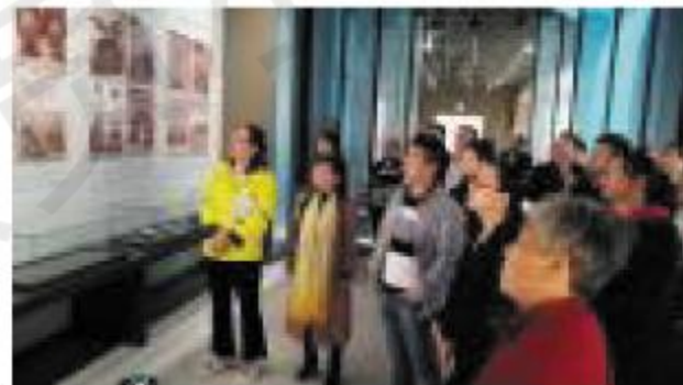
齐文化作为中华优秀传统文化的重要组成部分,蕴含了内容丰富、特色鲜明的廉政思想。在活动现场,大家对姜太公、管仲、晏婴、齐威王、齐宣王以及稷下学宫部分学者等代表人物的廉政思想进行了系统地参观学习,对“治国理政、廉政

为落实全面从严治党要求,筑牢广大党员干部反腐倡廉的思想防线,增强廉洁从业意识,10月26日,市自来水公司组织中层正职以上党员干部共50余人,走进临淄齐文化廉政教育基地进行参观学习,探寻廉政文化之源,重温廉政兴国历史规律,引导党员干部用历史坚定理想信念,切实增强纪律意识、规矩意识、责任意识,不断自重、自省、自警、自励,永葆廉洁本色。