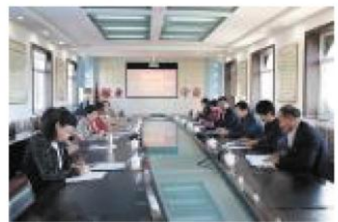
近日,省、市、区总工会一行8人,到淄博星展供水有限公司检查工会女职工权益保护专项集体合同履行情况。检查人员实地查看了公司工作环境、文化氛围及相关档案材料,并进行了座谈、交流。